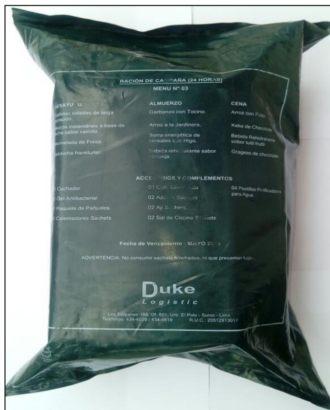
Imagen N°03 Ración de Campaña (24 horas) adquiridas el AF-2017