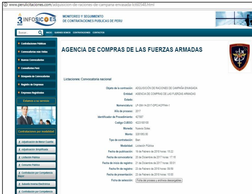
Imagen N°01 Reporte de la página oficial de la Agencia de Compras de las FFAA Licitación Pública-SM-14-2017-DPC/ACFFAA-1