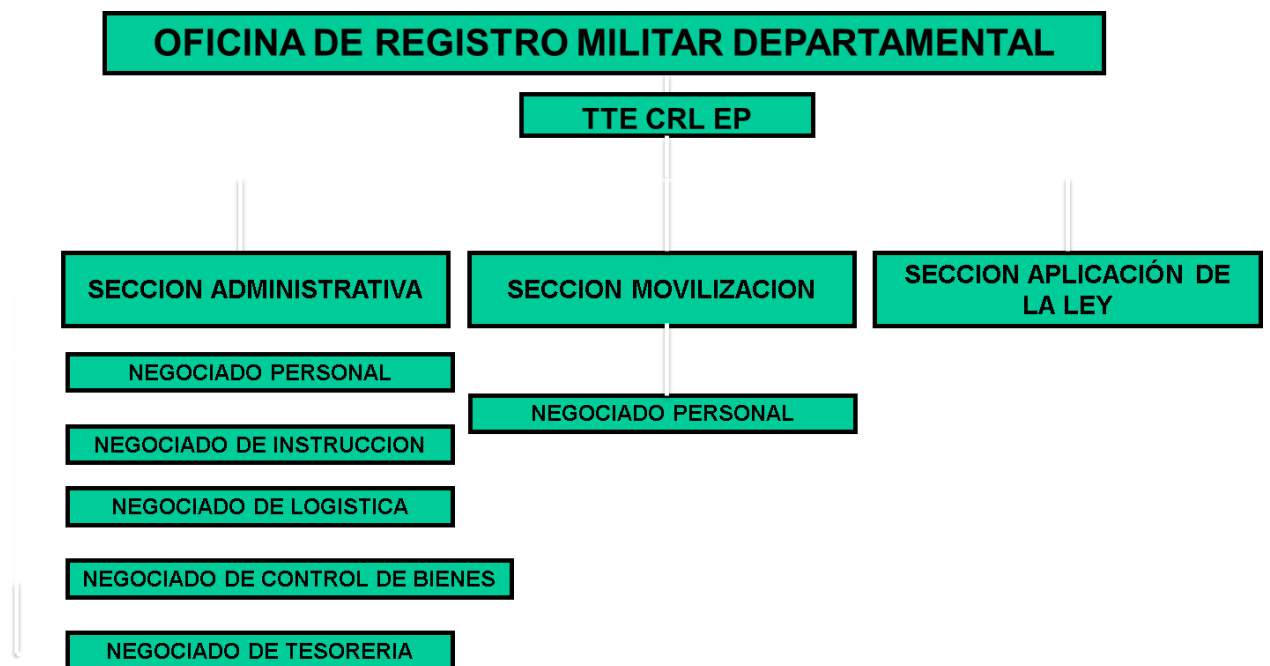
Figura 4. Organización Funcional de la ORMD 030 A