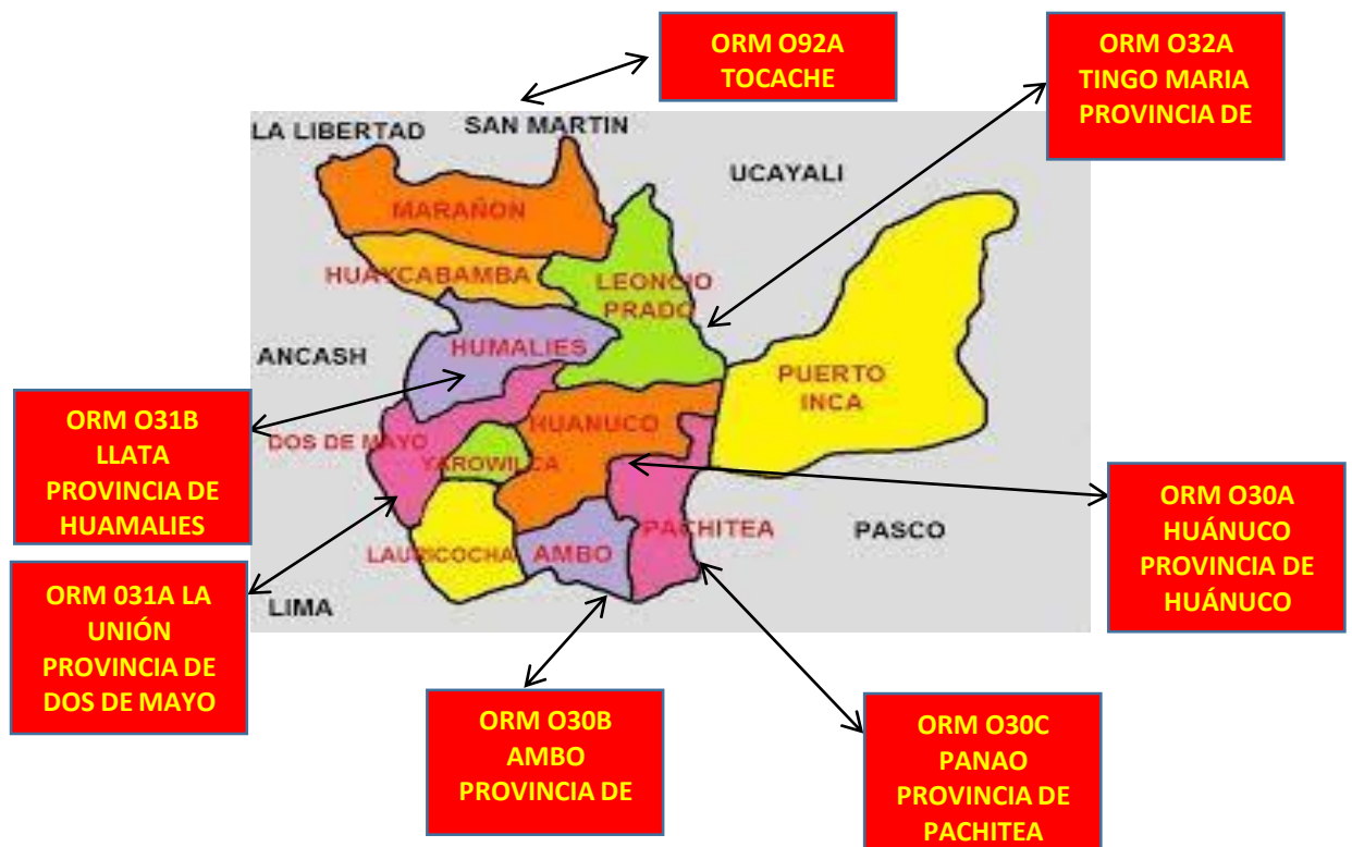
Figura 5. Ubicación geográfica de la ORMD 030 A - Huánuco