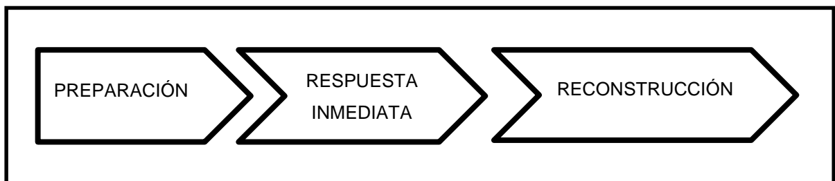
Ilustración 2. Fase de Reconstrucción

Garantiza el principio mismo de continuidad en el trabajo de reconstrucción y restablecimiento de la infraestructura básica para la población afectada. Depende de los militares que organizan el CIMIC, entender el momento adecuado para detener las acciones del CIMIC destinadas a la supervivencia (más inmediata) y cuándo comienza las actividades de reconstrucción estructural y restablecimiento.