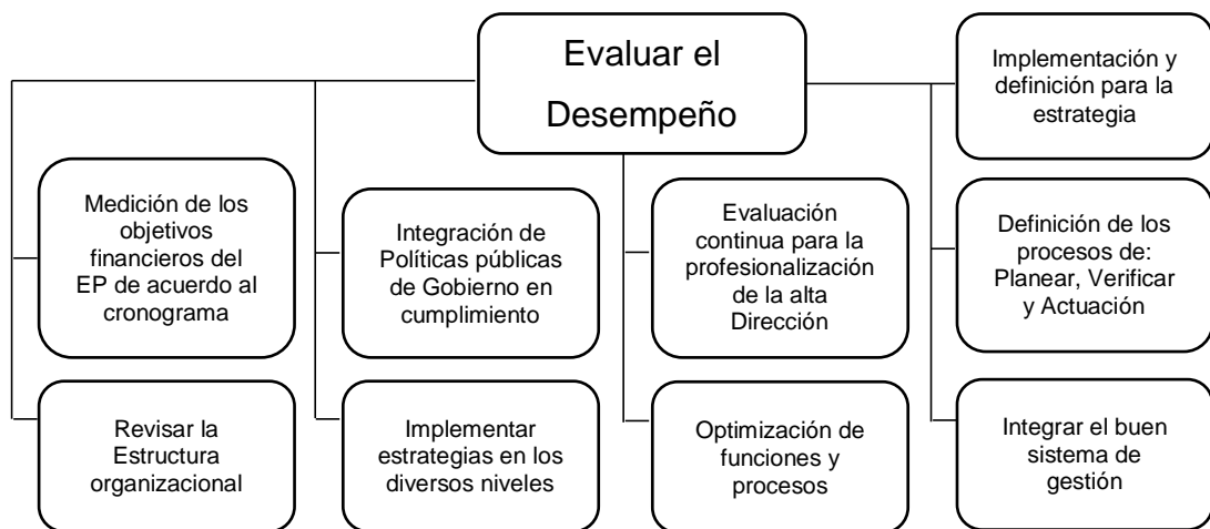
Figura 2. Evaluación del Desempeño.

En este sentido se tiene como otro objetivo proporcionar la Doctrina, Organización, Capacitación, Material y Personal calificado a las organizaciones y unidades para gestionar los procesos de Estrategias de Modernización de la Administración Pública. En sentido se considera importante establecer un proceso de evaluación del desempeño con el objetivo de lograr la mejora de los Recursos Humanos. Esta evaluación debe darse de la siguiente manera: