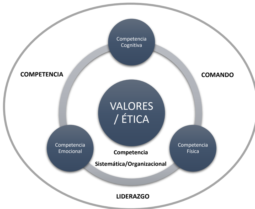
Figura 2. Competencias referidas a los Oficiales, sin especificar rango, arma o servicio.

La Figura 2 representa el Modelo de Competencias propuesto para el Ejército del Perú, presentando en el círculo interno la competencia central, referida a Valores y Ética, que regulan la conducta dentro de la Institución Militar. El segundo círculo comprende las habilidades de carácter más individual, específicas del individuo, es decir, las cognitivas, emocionales y físicas. Finalmente, en el tercer círculo se encuentra la competencia sistémica / organizacional, relacionada con los lineamientos estratégicos de la Institución y la competencia de mando y liderazgo.