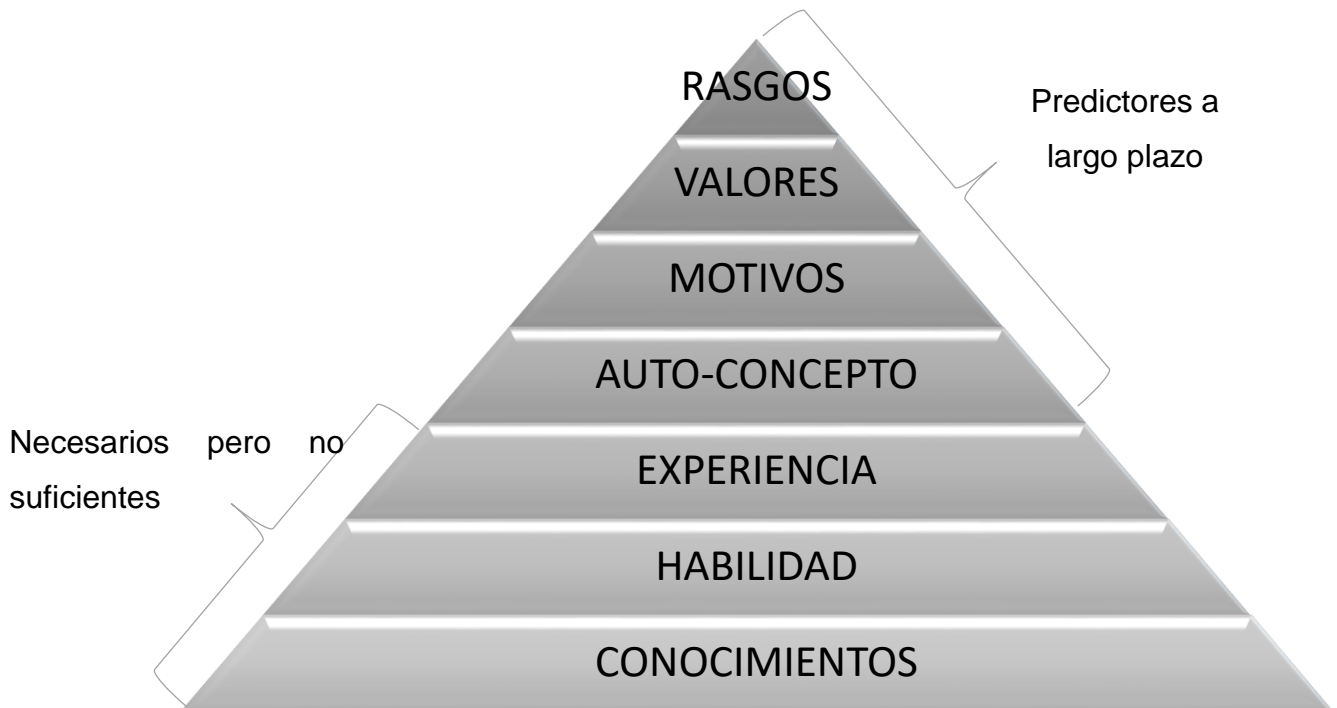
Figura 1. Modelo de competencias

Las Fuerzas Armadas de países como los Estados Unidos de América y la República de Singapur han adoptado un modelo de competencia propio adaptado a su realidad.