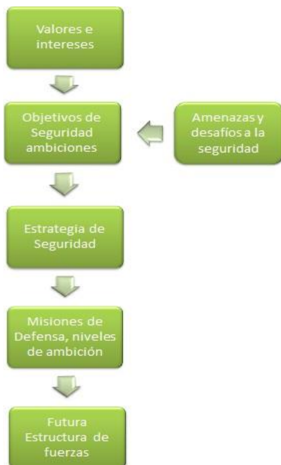
Figura 2. Objetivos de la Defensa