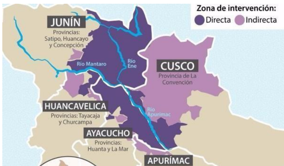
Figura 1. Valle de los ríos Apurímac, Ene y Mantaro

Provincia de Huancayo: (Santo Domingo de Acobamba y Pariahuanca)