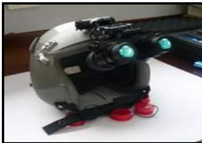
Figura 1. Sistema optrónico