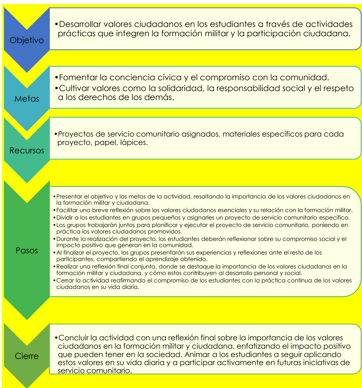
Tabla 6. Actividad 2: Desarrollo de valores ciudadanos