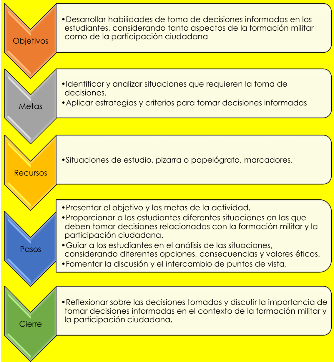
Figura 2: Actividad 1: Análisis de situaciones y toma de decisiones