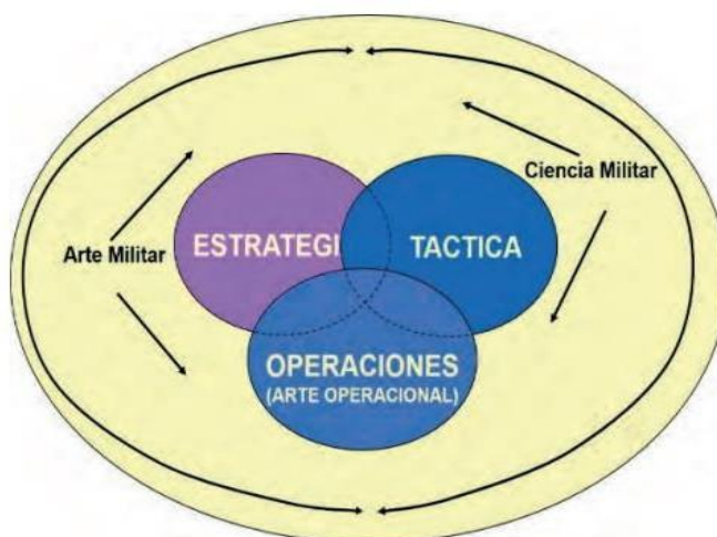
Figura 1. El arte operacional y la ciencia militar

En conjunto, este conjunto de herramientas se conoce como los elementos del Arte Operacional, que ayudan al comandante a comprender, visualizar y describir combinaciones de poder de combate y formular su intención y pautas. El comandante puede utilizar estas herramientas de forma selectiva en cualquier operación. Sin embargo, su aplicación más amplia se encuentra en el contexto de operaciones a largo plazo y más complejas (Graves y Bruce, 2013).