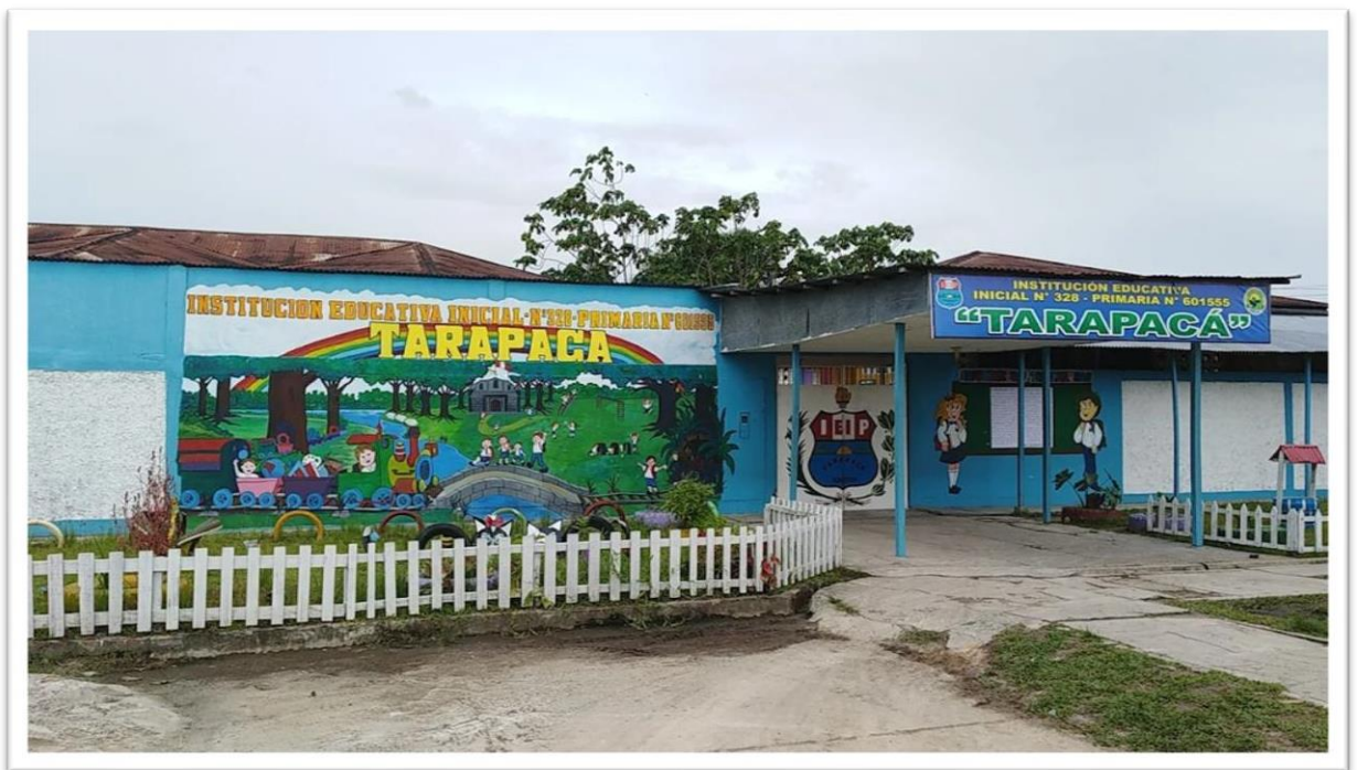
Figura 2, Frontis de la Institución Educativa Tarapacá de Iquitos

Para el presente trabajo de suficiencia profesional se ha considerado la parte de bienestar el personal que sirve en la región de Iquitos, debido a que sus hijos se educan en la Institución Educativa Tarapacá, la importancia de otorgar un servicio de calidad con altos estándares de nivel que incluyen la gestión de la dirección de un Oficial del Ejército asignado para esa tarea educativa, la capacitación del personal que atiende esta importante misión, la parte administrativa y la cultura organizacional que redunda en el bienestar del personal de la V División de Ejército que cuenta con hijos en esta edad escolar y que está bajo la administración del Ejército.