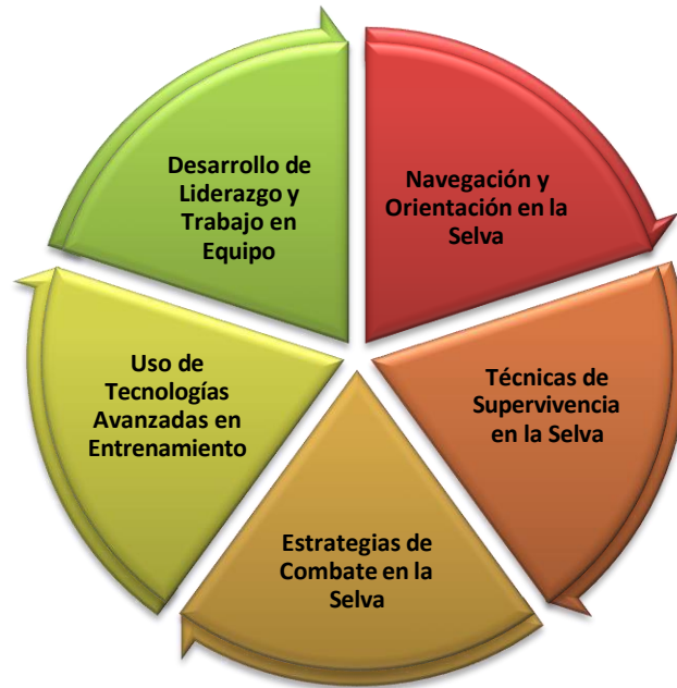
Figura 1 Esquema de la descripción de la propuesta